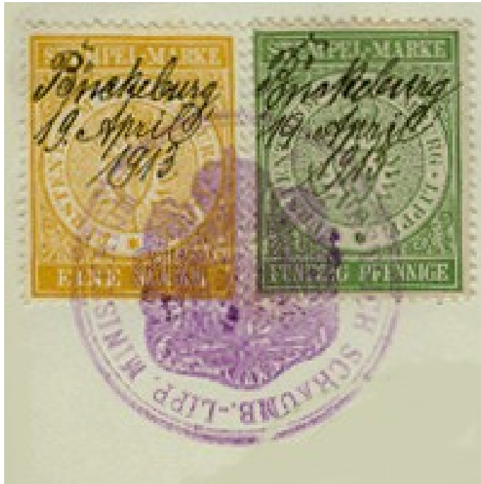
Abb. 3: Fiskalmarken S.-L. kleines Lippe – großes fürstliches Staatswappen. Staatswappen der Ausg. 1910.

Die Petschaft bildet das große fürstliche Staatswappen mit einem Herzschild ab, das das Stammwappen der Grafschaft Schaumburg (nesselblattförmiger Schildbelag) war.