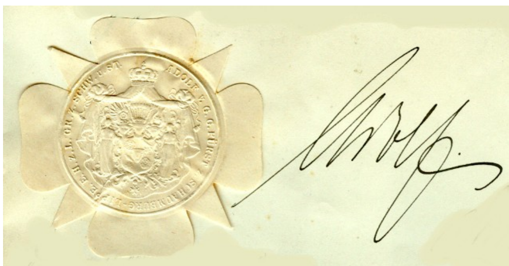
Abb. 2: Unterschrift von Adolf II. (Fürst Schaumburg)

Die Urkunde zeigt die Unterschrift des Fürsten Adolf II. mit Datum vom 19. April 1913 neben dem gepetschten Papiersiegel des Fürstentums Schaumburg-Lippe (Abb.2).